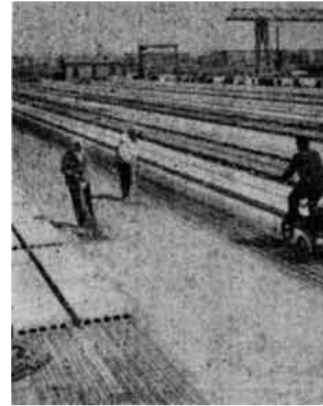
省系统级先进企业——市双田实业总公司在抓好预制构件这个龙头产品的同时，根据市场需求迅速开发多种产品，增强了企业活力。